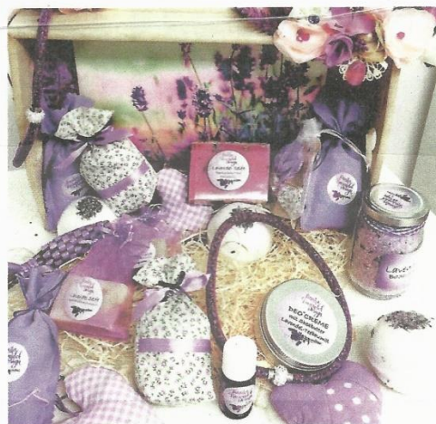
Mittlerweile gibt es im Sortiment viele verschiedene Produkte rund um Lavendel.

Lavendel duftet aber nicht nur gut, er ist auch gesund. So wirkt er zum Beispiel beruhigend, bei Entzündungen im Hals-, Nasen- und Ohrenbereich und auch bei der Wundheilung, der Narbenbehandlung und bei Hautirritationen. Er ist gut für Haut- und Haarpflege, bei Magen- und Darmproblemen, zur Insektenabwehr und für vieles mehr. ▲▼