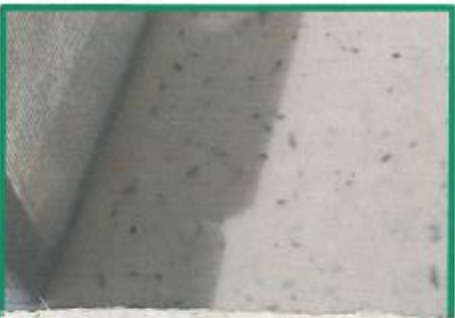
helles Papier, wobei die Pflanzenteile unterschiedlich dunkel „ausbluten“