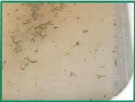
Pulpe (Recyclingpapierbrei) mit festen Pflanzenteilen des Thymians – es riecht hervorragend!!