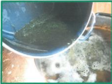
Thymiantee wird der Pulpe (Papierbrei aus Cellulose) zugefügt und dadurch gefärbt. Die weichen Pflanzenteile werden vor dem Schöpfvorgang zugefügt.