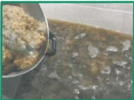
Warme Pulpe, die sich bis zum Ende des Schöpfvorganges ziemlich dunkel verfärbt.