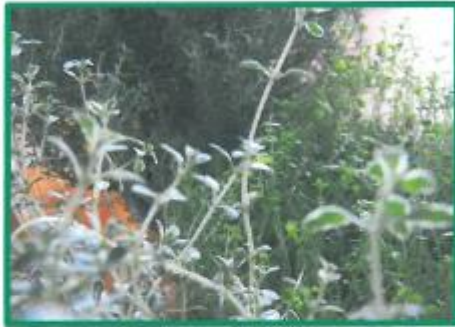
Verschiedene Thymianpflanzen für die Kultur im Garten